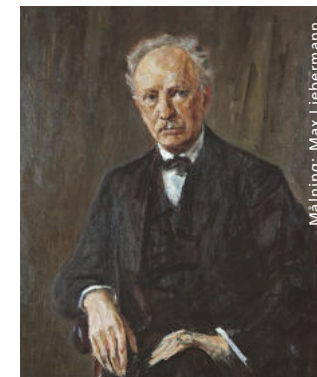
Målning: Max Liebermann